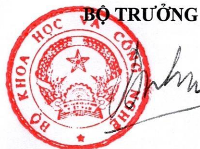
Chu Ngọc Anh

2. Việc sửa đổi, bổ sung Quy chế này do Hội đồng Viện, Viện trưởng Viện Khoa học và Công nghệ Việt Nam - Hàn Quốc phối hợp với các đơn vị có liên quan đề nghị Bộ trưởng Bộ Khoa học và Công nghệ và Bộ trưởng Bộ Tài chính xem xét, quyết định./.